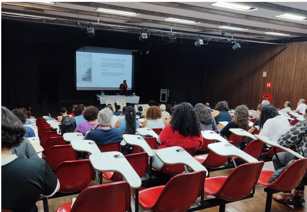
Auditório da Escola de Belas Artes da UFMG, no Seminário sobre o Projeto de Conservação e Restauração do Painel de Mário Silésio, no antigo prédio do Detran/MG Data: 25/11/2024