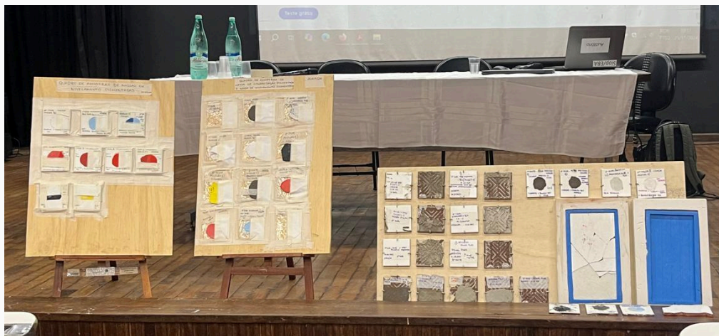
Testes de cor, argamassa, reboco produzidos durante o Projeto Autoria: Natália Morita Data: 25/11/2024